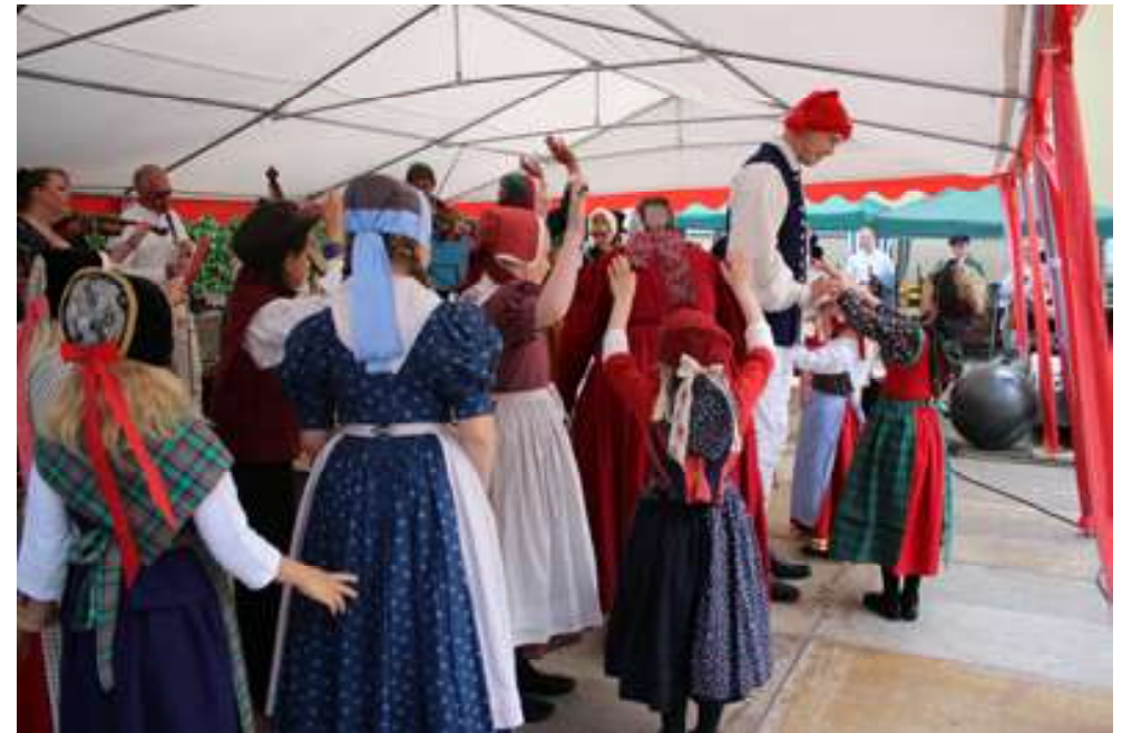
SBU 2017 i Køge, hvor Familieholdet dansede en flot opvisning